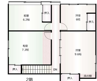
間取り図と現況が異なる際には、現状有姿となります。