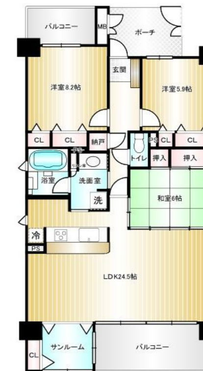
現状と間取り図が異なる際は、現状有姿となります。